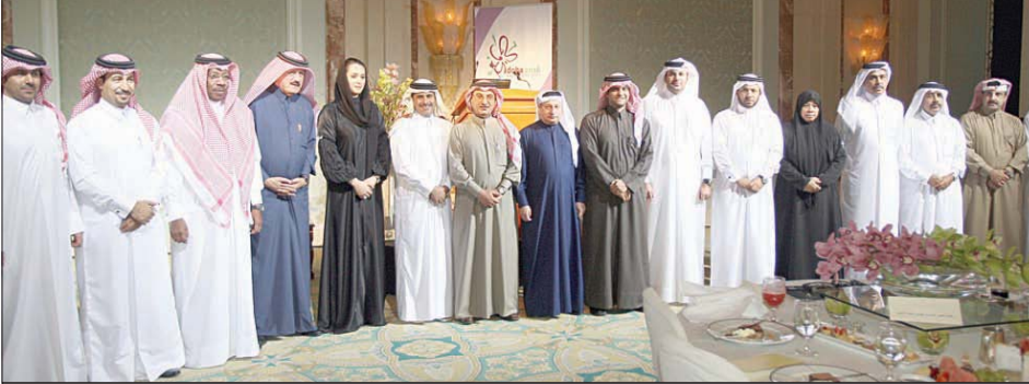
إمادة على شرف اتحادات الرياضة بقطر